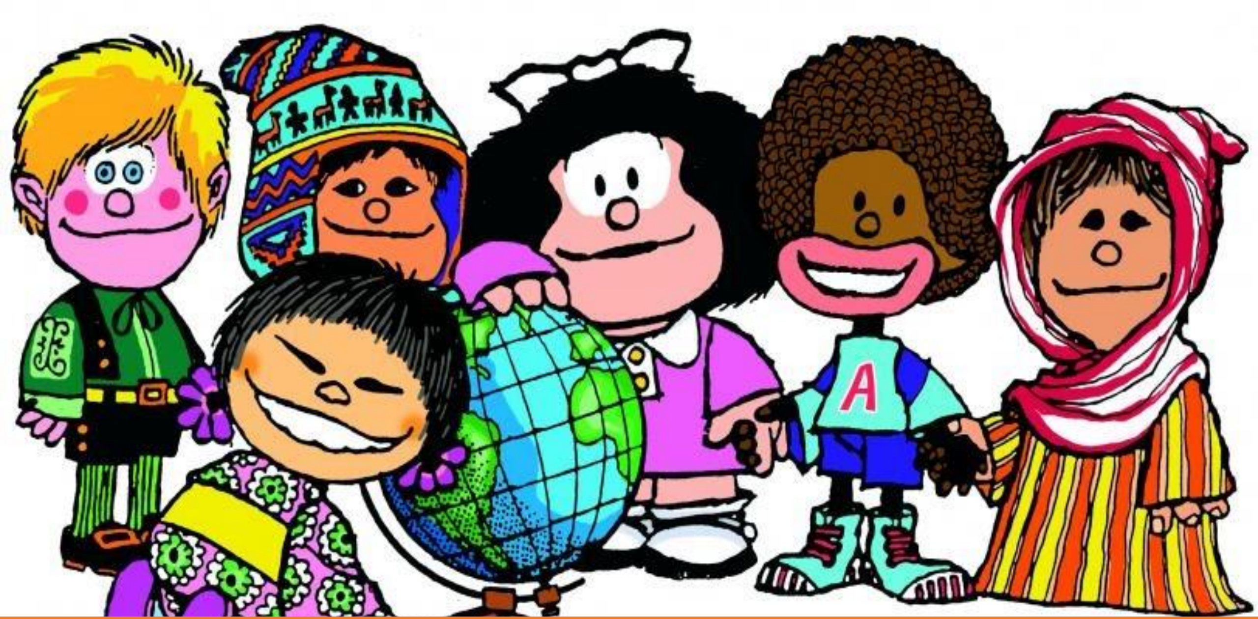
Interculturaliteit in Ecuador: uitdagingen en opportuniteiten